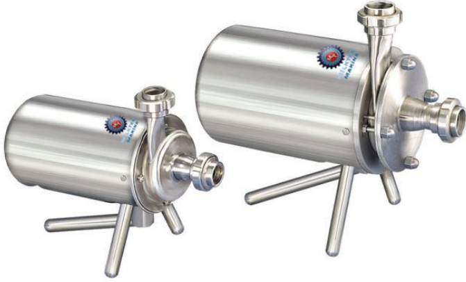
Santrifüj Transfer Pompaları Centrifugal Transfer Pumps Центробежные насосы

Açık fanlı ve kapalı fanlı olarak çeşitli kapasitelerde üretilmektedir.